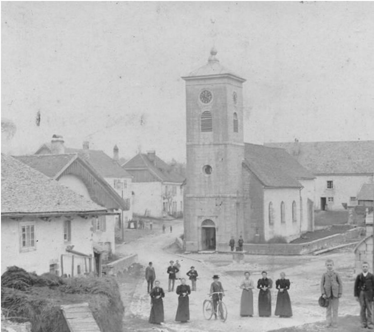
L'ancienne église -

Photo prise en 1898 par Francis GRUX, Photographe et peintre à Frambouhans puis à Maiche